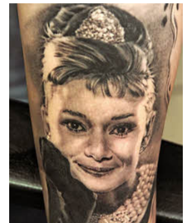
Der Portraitspezialist aus Kitzingen zählt zu den Stars der Körpermaler.