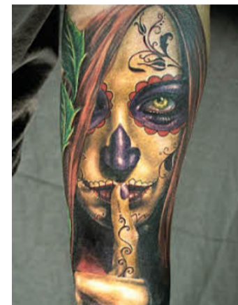
Dieses Motiv von Andy hat es nicht nur auf die Haut geschafft. Sullen Clothing hat es auf T-Shirts, Taschen und vielen weiteren Produkten verewigt.